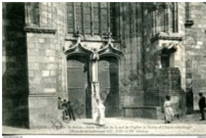
111. Reims - From Chapter to East of Chapter in North of Chapter entrance